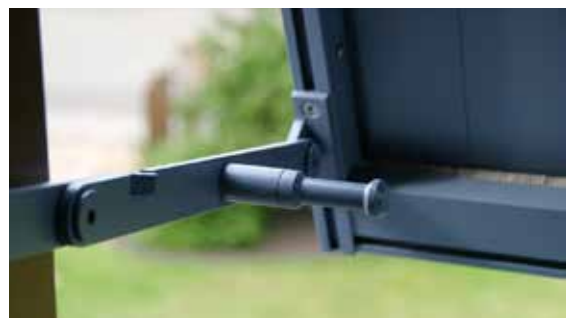
Option Aussteller in verschiedenen Versionen